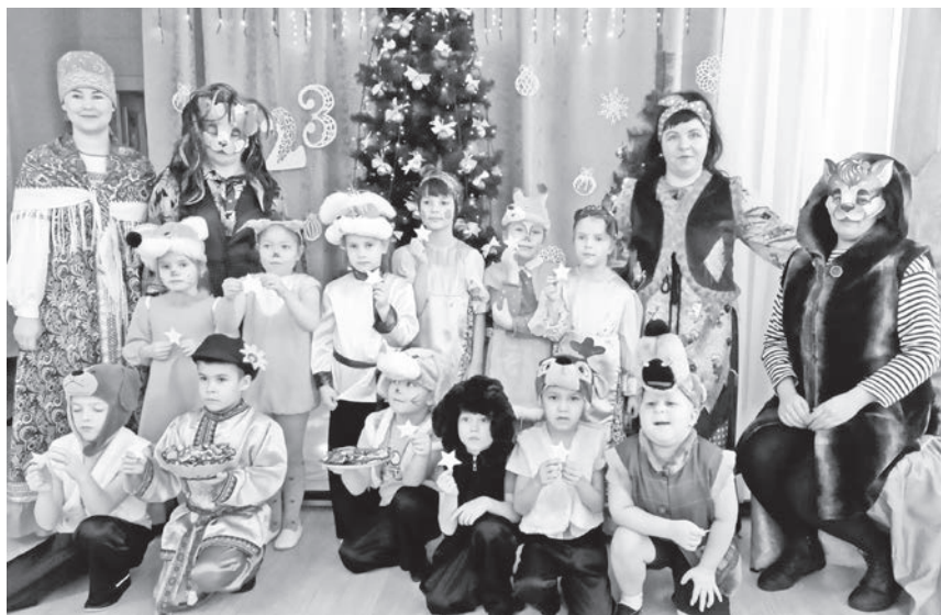
С пожеланиями богатства и счастья ряженые обошли весь детский сад.

В Святочные вечера устраивались на Руси праздничные гуляния: по дворам ходили толпы ряженых, пели величальные песни, в которых славляли хозяев, желали им доброго здоровья, богатого урожая. Все с нетерпением ожидали прихода ряженых. Люди верили, что, к кому они зайдут, тот двор в новом году удачлив будет, с достатком и прибылью.