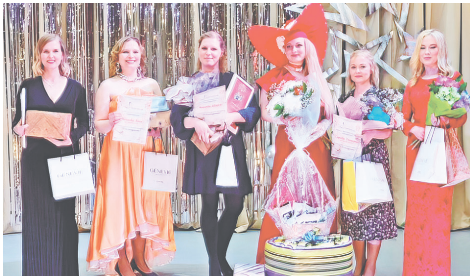
Конкурс «Десять блондинок» в Байкаловском ЦДК.