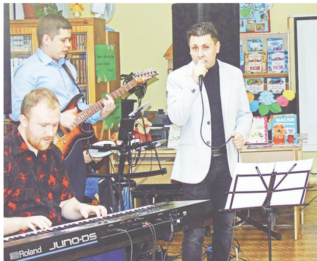
В Байкаловской центральной библиотеке прошло мероприятие – «Литературно-музыкальная гостиная».